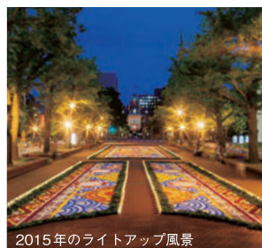
2015年のライトアップ風景

昨年、資金不足により実施できなかった「夜のライトアップ」を復活させるため、会期前クラウドファンディングに初挑戦し、ライトアップが実現しました！日本新三大夜景都市・札幌の新たな夜景観光スポットとして「サッポロフラワーカーペット」が幻想的にライトアップされます。