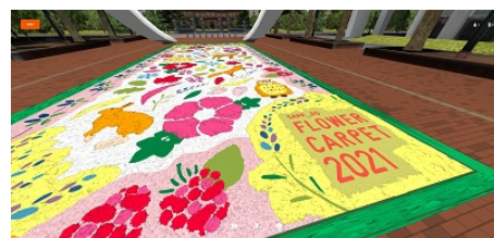
フラワーカーペットを忠実に再現

リアルな会場では開催期間も比較的短く、現在はコロナ禍で集客が困難な各種イベントにおいてもバーチャル空間では、いつでもどこからでも、期間や場所の制約を越えて開催できます。バーチャル空間の特性を活かし、同時に複数の催しや展示、パブリックビューイング等を実施できるほか、リアルのイベントの前夜祭／後夜祭を開くなど、地域ならではの新しい賑わいの創出につながられます。