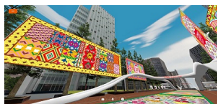
アーカイブされたフラワーカーペット

現実の空間では設置できないような大掛かりな入退場ゲートや高台などをバーチャル空間上に設置して、高い場所から多様な視点で「フラワーカーペット」を楽しむことができます。また各種パネルを設置して、フラワーカーペットの作り方や2021年のリアル会場の展示物の制作風景などを、動画を交えて紹介します。バーチャルならではの自由な表現力を活かし、現実空間とは異なる体験価値を提供します。