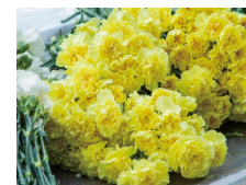
カーネーション (オレンジ・黄色・白)